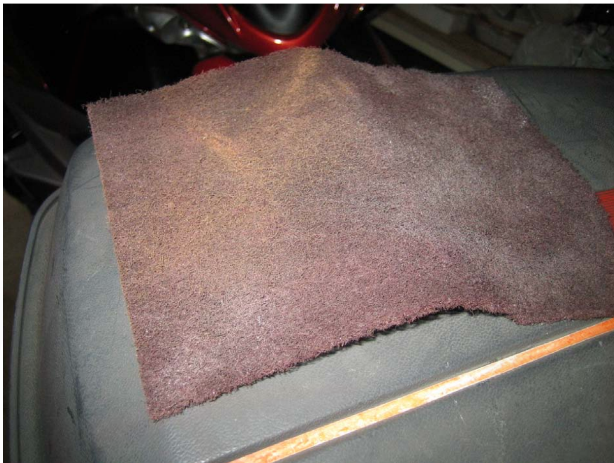
Aggrappante spray per materiale plastico