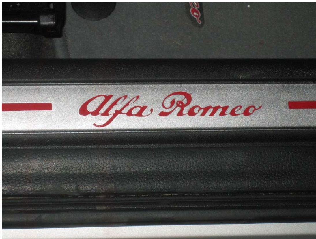
Anteriore lato guida